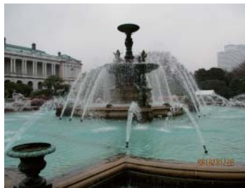
「迎賓館の噴水」