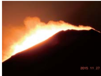
「富士山、燃ゆ」

・青空に季長く触れ爽竹桃 ・掘り進む夏 地球のみやこ出て来たり ・空蟬にも火傷のはしる八月は