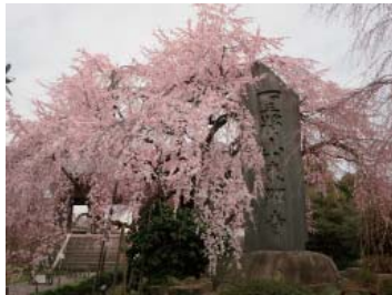
「東郷寺の桜」